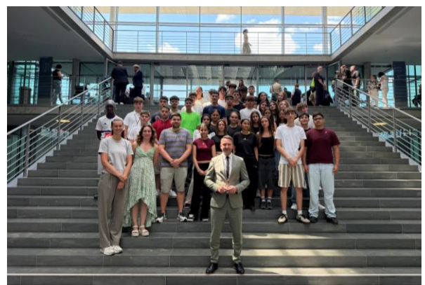
Mit den Schülerinnen und Schülern der Ludwig-Dürr-Schule im Paul-Löbe-Haus.

An diesem Mittwochnachmittag konnte ich gut 40 Schülerinnen und Schüler der neunten Klasse der Ludwig-Dürr-Schule aus Friedrichshafen mit ihren Lehrerinnen und Lehrern zu einem einstündigen politischen Gespräch hier im Paul-Löbe-Haus begrüßen. Dabei ging es unter anderem um mehrere aktuelle Themen der Tagespolitik, aber wir diskutierten auch über den Alltag eines Bundestagsabgeordneten sowie über das politische Geschäft im Allgemeinen. Im Anschluss an unser Gespräch ergab sich dann noch die Gelegenheit für ein gemeinsames Foto. Ich freue mich immer sehr über Besuch aus dem Wahlkreis. Informationen über die sich hier bietenden verschiedenen Möglichkeiten für Schulklassen und/oder Gruppen finden Sie auch auf meiner Internetpräsenz.