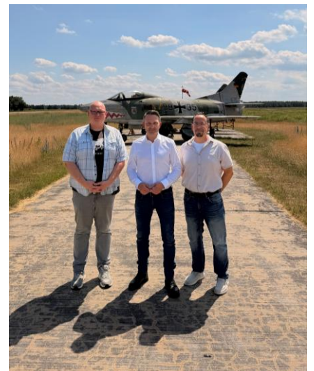
Einige Impressionen von einem beeindruckenden Tag.