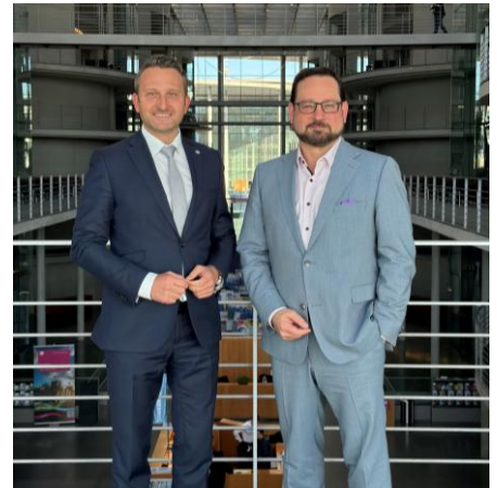
Mit Alexander Bonde im Paul-Löbe-Haus.

In meiner Funktion als Mitglied des Umweltausschusses und insbesondere als Nachhaltigkeitspolitischer Sprecher der CDU/CSU-Bundestagsfraktion traf ich mich am vergangenen Mittwochnachmittag mit dem Generalsekretär der Deutschen Bundesstiftung Umwelt und früheren baden-württembergischen Minister für den Ländlichen Raum und Verbraucherschutz, Alexander Bonde , zu einem Gedankenaustausch über Umweltpolitik und Nachhaltigkeitsthemen. Dabei wurde klar, dass wir in Deutschland bereits sehr weit sind, aber es trotzdem immer noch viele Bereiche gibt, in denen wir besser werden müssen und können. Sehr interessant war dabei auch ein Blick auf die zahlreichen Umwelt- und Naturschutzprojekte, die gerade in der Bodenseeregion von der Deutschen Bundesstiftung Umwelt gefördert werden – vom Insekten- über den Trinkwasserschutz bis zum ressourcenschonenden Bauen.