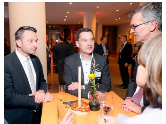
Im Austausch mit den Vertretern der baden-württembergischen Kliniken.

Es ist bereits fast eine Tradition, dass die baden-württembergische Krankenhausgesellschaft die Bundestagsabgeordneten aus dem Südwesten in regelmäßigen Abständen zu einem Gedankenaustausch in die Landesvertretung im Berliner Tiergarten einlädt. Gerade hinsichtlich der nun unmittelbar anstehenden Reformen war es mir ein Anliegen, den Austausch mit den Vertretern unserer heimischen Kliniken zu suchen. Dabei wurde klar: die Probleme der Krankenhäuser sind massiv, seit vielen Jahren bekannt – und leider immer noch ungelöst. Es gibt große Strukturprobleme , deren Lösung den Schlüssel für die zukünftige Krankenhausversorgung darstellen. Ich hoffe, dass die jüngsten Reformen im Krankenhausbereich, deren gerade erst beschlossene Anpassung sowie die von Gesundheitsministerin Nina Warken geplanten Maßnahmen, für nachhaltige Verbesserungen sorgen.