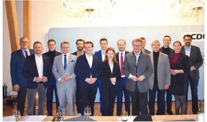
Alle Kandidaten, die aus unserer Region, für die Landesliste der CDU Baden-Württemberg kandidieren.