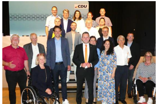
Mit den neu gewählten Mitgliedern des Kreisvorstands der CDU Bodenseekreis.