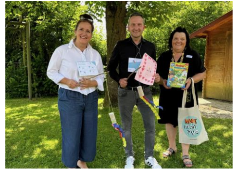
Im Kindergarten St. Antonius in Friedrichshafen am MINTmachttag.

Im Zuge des MINTmachtages – über viele Jahre besser bekannt als „ Tag der kleinen Forscher “ – besuchte ich am 19. Juni den Kindergarten St. Antonius in Friedrichshafen. Die Kinder des Kindergartens hatten sich mit dem diesjährigen Schwerpunktthema „Freiheit“ beschäftigt und stellten mir bei meinem Besuch die Ergebnisse ihrer Forschungen vor. Zudem beteiligte ich mich auch aktiv, indem ich gemeinsam mit den Kindern forschte und bastelte . Darüber hinaus brachte die Kindergartenleitung mir gegenüber Ihr großes Unverständnis darüber zum Ausdruck, dass das Schulf Frucht-Programm demnächst auslaufen wird . Dies ist meiner Meinung nach schwer nachvollziehbar. Gerade auch mit Blick darauf, dass die Erziehung der Kinder zu gesunder Ernährung – aber auch zu ganz alltäglichen Anstandsformen – inzwischen bedauerlicherweise aus vielen Familien in die Kindergärten gerückt wird. In diesem Zusammenhang macht aber auch die Suche nach geeignetem Fachpersonal den Kindergärten stark zu schaffen. Ein aufschlussreicher Tag – vielen Dank dafür!