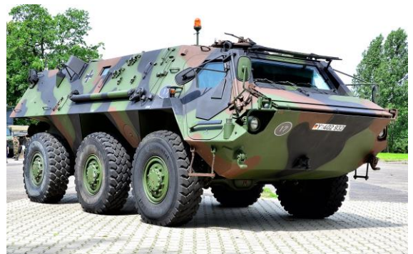
Der Schützenpanzer Fuchs wurde bislang zu großen Teilen in der Region gefertigt.

In den vergangenen Tagen und Wochen bin ich von zahlreichen Bürgerinnen und Bürgern auf die zumindest fragwürdige Entscheidung der Bundesregierung bzw. des Verteidigungsministeriums angesprochen worden, als Nachfolger des Transportpanzers Fuchs auf ein Modell zu setzen, das im Ausland produziert wird . Bislang wurde der Fuchs ausschließlich in Deutschland – und seine Motoren sogar in Friedrichshafen produziert. Gerade in der aktuellen Situation nicht auf eine Stärkung der heimischen Rüstungsindustrie zu setzen, stößt auf mein Unverständnis – und ebenfalls auf jenes meiner CDU/CSU-Kollegen im Bundestag. Meine bedauerlicherweise bisher nicht veröffentlichte Pressemitteilung zu diesem Thema vom 14. Juni finden Sie hier im Original.