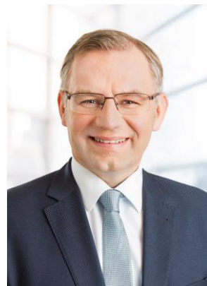
Norbert Lins MdEP