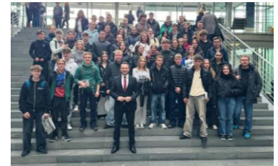
Mit den Schülerinnen und Schülern der Bodenseeschule im Paul-Löbe-Haus