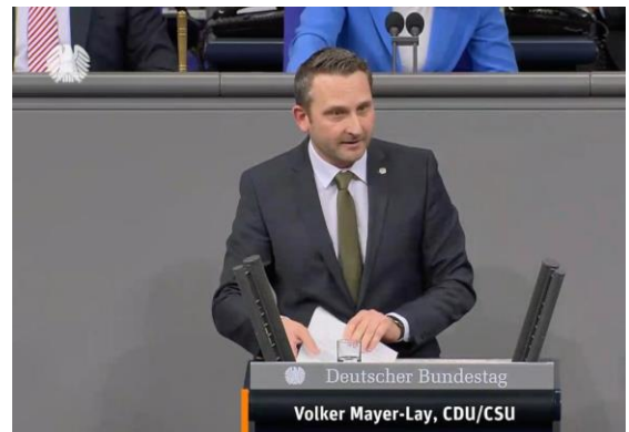
In meiner Rede verwies auf die Notwendigkeit des Kormoranmanagements.

Vorgestern Abend brachte ich – gemeinsam mit meinen Kolleginnen und Kollegen aus dem Ausschuss für Umwelt- und Verbraucherschutz sowie aus dem Landwirtschaftsausschuss – den von mir ausgearbeiteten Antrag „Kormoranmanagement – Schutz von Artenvielfalt und Fischereibeständen“ , der die Eindämmung der Kormoran-Population zum Ziel hat, in erster Lesung in den Bundestag ein. Hintergrund ist, dass der Kormoran trotz massiven Wachstums seiner Population immer noch stark geschützt ist und inzwischen durch seine enorme Verbreitung eine Gefahr für andere Tierarten, insbesondere aber für die Fischbestände darstellt . Zentrales Element des Kormoranmanagements soll dabei ein bundesweiter „Aktionsplan Kormoran“ mit Maßnahmen zur Regulierung und zur Eindämmung der Vermehrung des Vogels sein.