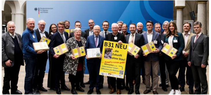
Bei der Übergabe der Unterschriften im Rahmen der Pro B31-Aktion im Bundesverkehrsministerium.