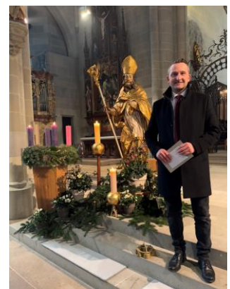
Nik'laus ist ein guter Mann! – Eindrücke aus Überlingen.