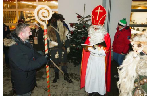
Auch mir hatte der heilige Nikolaus so einiges mitzuteilen.