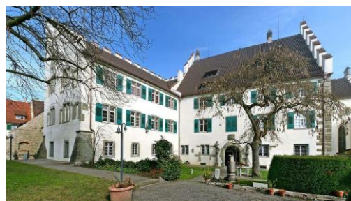
Das Städtische Museum in Überlingen

Es ist ein trotz seines massiven Äußeren recht verstecktes Kleinod – das Städtische Museum Überlingen. Das Reichlin-von-Meldegg-Patrizierhaus aus dem 15. Jahrhundert ist bereits seit 1871 Museum und erhält nun aufgrund eines erfolgreichen Förderantrags gut 13.000 Euro. Mit dieser Summe aus einem gemeinsamen Förderprogramm von Bundeslandwirtschaftsministerium und der Kulturstaatsministerin Monika Grütters wird die Funktion des Museums als Lern-