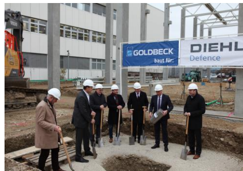
Bei der Grundsteinlegung in Überlingen

Es gibt sie noch – die guten Nachrichten aus der Wirtschaft. So war es ein erfreulicher Anlass, kurz nach Beginn meiner Amtszeit beim Spatenstich für den Erweiterungsbau bei der Diehl Defence GmbH , einem der größten Arbeitgeber in meiner Heimatstadt Überlingen, dabei sein zu können. Trotz Corona-Krise und der Herausforderung des Fachkräftemangels investiert das Familienunternehmen Diehl in Überlingen.